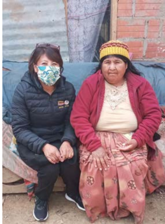
da die Mutter bisher über einer offenen Feuerstelle kochen musste.